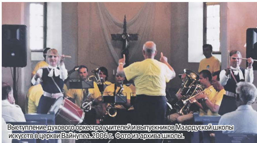
Выступление духового оркестра учителей и выпускников Маардуской школы искусств в церкви Вайнупеа. 2006 г.