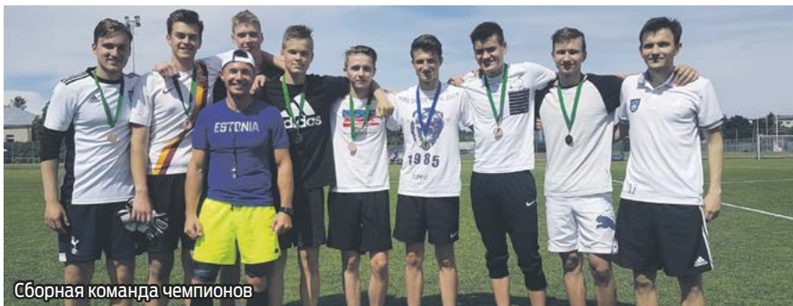
Сборная команда чемпионов