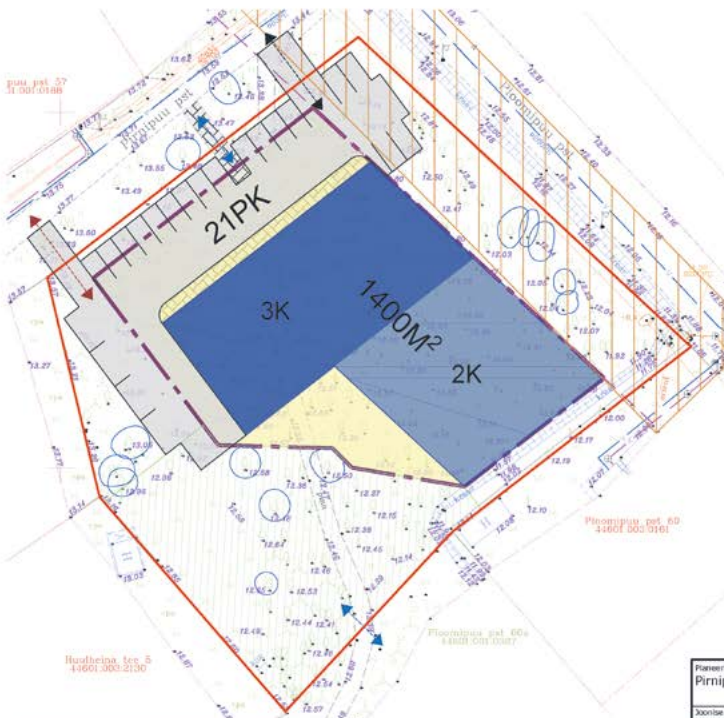
ESKIISI AVALIK VÄLJAPANEK