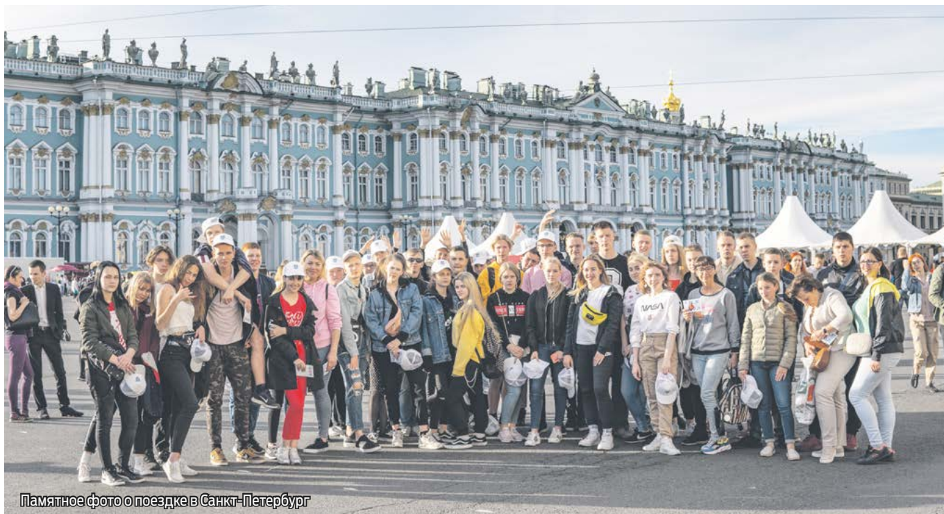
Памятное фото о поездке в Санкт-Петербург