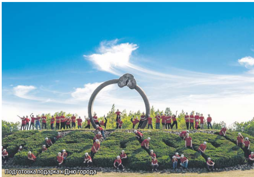
Подготовка подарка к Дню города

Причина популярности дружины не только в возможности для молодых людей заработать деньги, но и поучаствовать во время каникул во многих интересных проектах. Например, в этом году мы решили организовать курсы самообороны, которые очень понравились и юношам, и девушкам дружины. Теоретические и практические занятия по самообороне