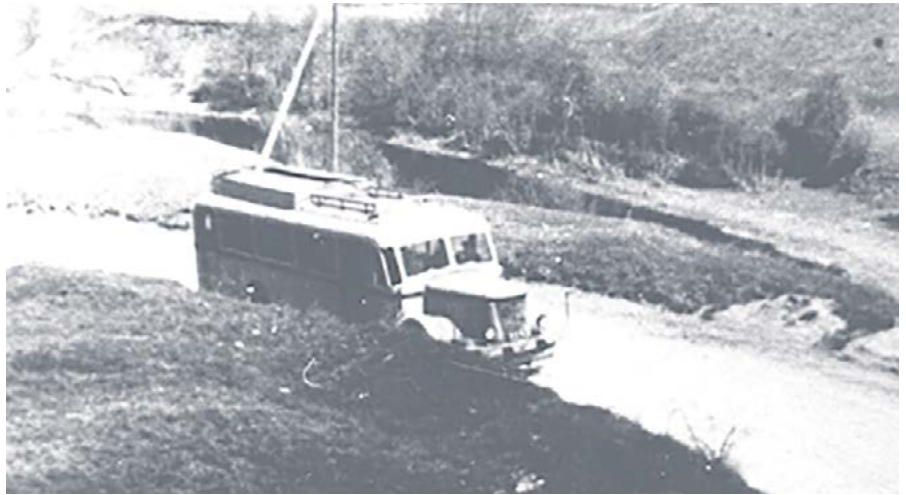
Исторический снимок: первый автобус, следующий из Таллинна в Маарду

Орфография и пунктуация автора сохранены. Продолжение читайте в следующем номере.