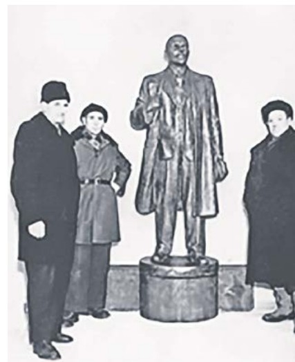
Этот памятник Ленину, до 1990 года стоявший в нынешней основной школе, был при советской власти единственным.

Первый фотоаппарат, который он себе приобрел, был широкоплечный «Комсомолец». Потом купил немецкий «Фогтлендер», более компактный. В карман помещался. Как всякий уважающий себя фотограф, аппарат он всегда имел при себе – мало ли что понадобится срочно запечатлеть. Вот и в кино как-то пошел с ним. А когда направлялся обратно – похолодел от ужаса, обнаружив, что фотоаппарата, самой большой его ценности, в кармане нет. Видимо, выпал или в зале, или уже при выходе. Кинулся обратно – в зале нет. Опять на улице, стал расспрашивать людей, идущих из кино, – не видели ли случайно? Бесполезно... Всю жизнь не мог простить себе этой оплошности.