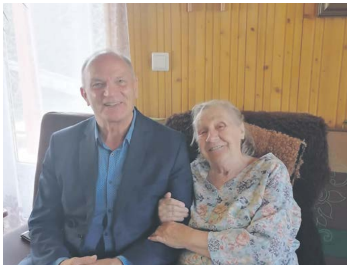
4 сентября ИГЛА РЯЭСК отметила свой 90-й день рождения