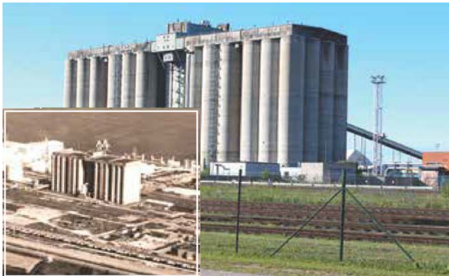
Элеватор в порту Мууга, построенный в 1986 году по самым современным требованиям, и сегодня мог бы использоваться по назначению. Он и используется, но значительно меньше, чем позволяют его возможности.