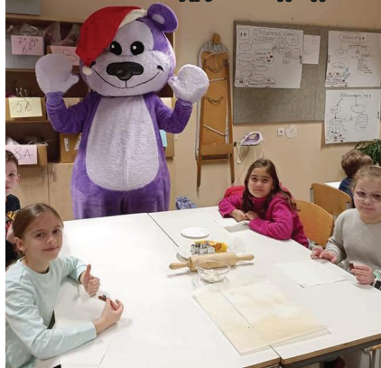
Изготовление рождественского печенья вместе с Другом Медведем