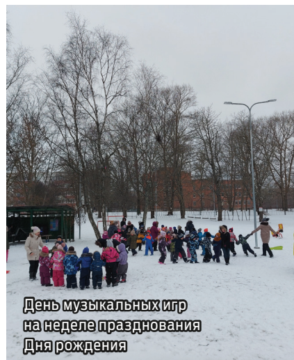
День музыкальных игр на неделе празднования Дня рождения

в группах проходили различные тематические занятия, говорили о детском саду, о том, кто в нем работает и какие задачи выполняет. Всю неделю можно было участвовать в викторине «Хорошо ли ты знаешь свой детский сад?», в которой нужно было отгадать ребус и расшифровать секретное послание.