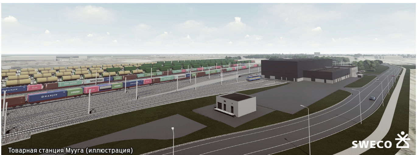
Товарная станция Мууга (иллюстрация)

Rail Baltica – это экологически чистое и удобное железнодорожное сообщение, соединяющее Эстонию с ее южными соседями и Центральной Европой. Создаваемая инфраструктура позволит пассажирам добираться из Таллинна до Пярну за 40 минут и до Риги за 1 час 42 минуты, а также снизит воздействие грузового транспорта на окружающую среду. По трассе Rail Baltica также будут курсировать и региональные поезда.