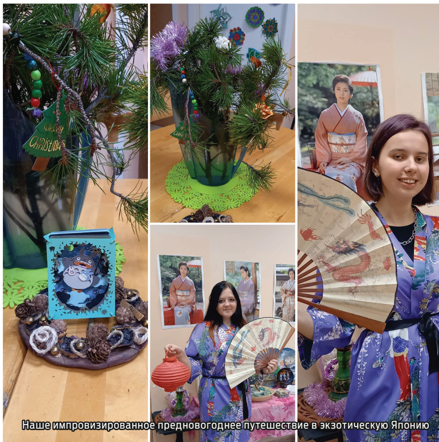
Наше импровизированное предновогоднее путешествие в экзотическую Японию