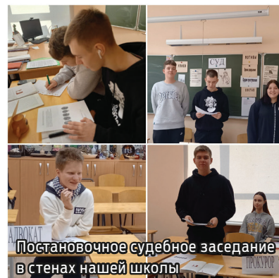
Постановочное судебное заседание в стенах нашей школы

В это чудесное время Маардуская основная школа желает всем исполнения желаний и здоровья!