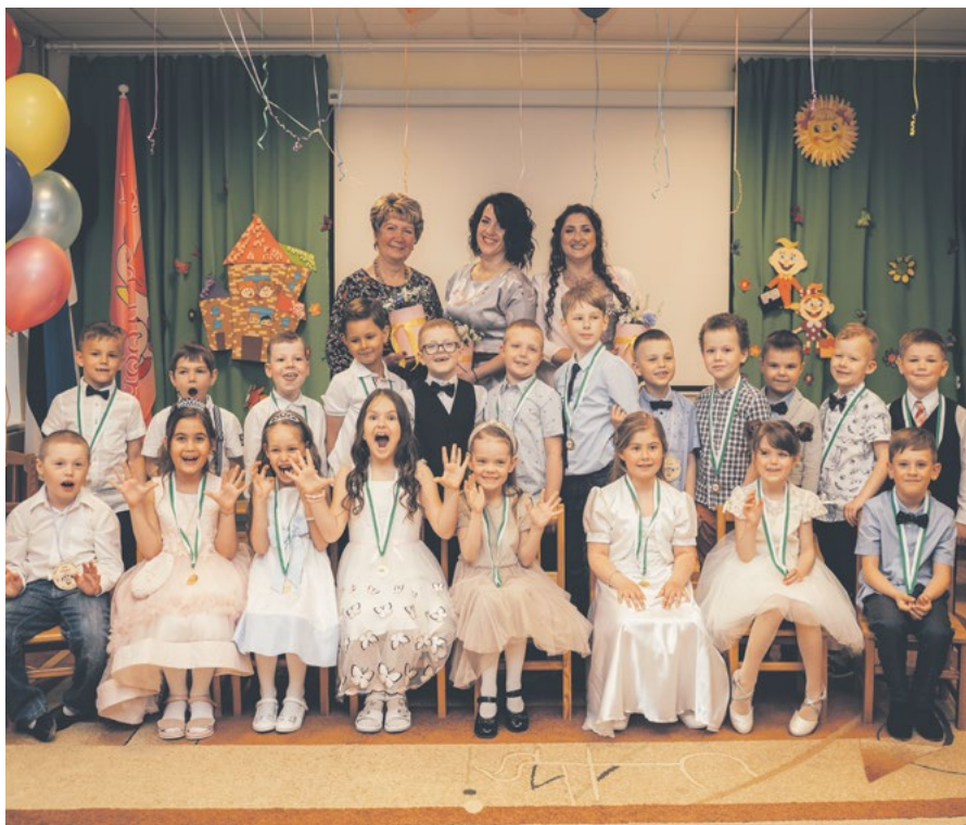
Выпускники группы «Чебурашка» вместе со своими наставниками