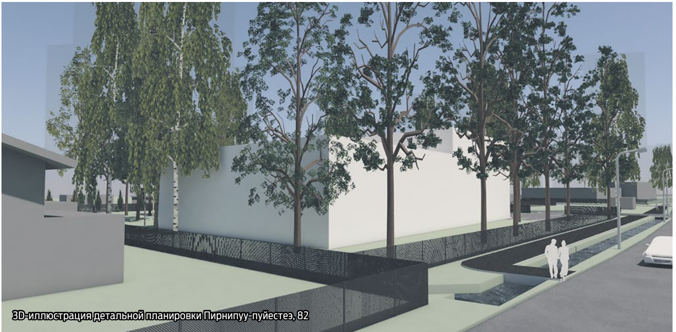
3D-иллюстрация детальной планировки Пирнипуу-пуйестеэ, 82

С иницированными и установленными детальными планировками можно ознакомиться на сайте города Маарду: https://maardu.kovtp.ee/detailplaneeringud или по предварительной договоренности в отделе строительства и планирования Маардуской городской управы по адресу ул. Калласмаа, 1, Маарду; linnavalitsus@maardu.ee , тел. 6060702.