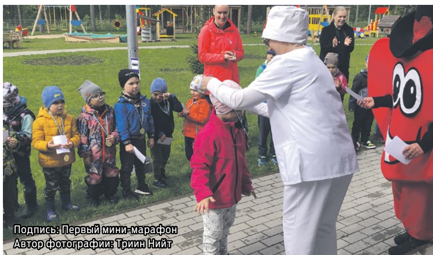
Подпись: Первый мини-марафон

сада и выразить благодарность спасательной команде Мууга, которая заботится о безопасности в нашем родном крае. 30 ноября мы передали спасательной команде Мууга 112 игрушек-зверьков, которые поселились в спасательных машинах, чтобы радовать и утешать попавших в беду детей. За реализацию проекта мы получили благодарственное письмо от генерального директора Спасательного департамента.