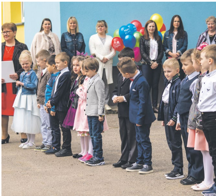
Прощание с детским садом

Работники детского сада «Руккилилль» приложили максимум усилий, чтобы прощание с детским садом стало незабываемым событием как для выпускников, так и для их родителей. Итак, 28 мая наши талантливые дети попрощались с детским садом и теперь готовятся к новому жизненному этапу – поступлению в школу. Казалось бы, только вчера эти милые ма-