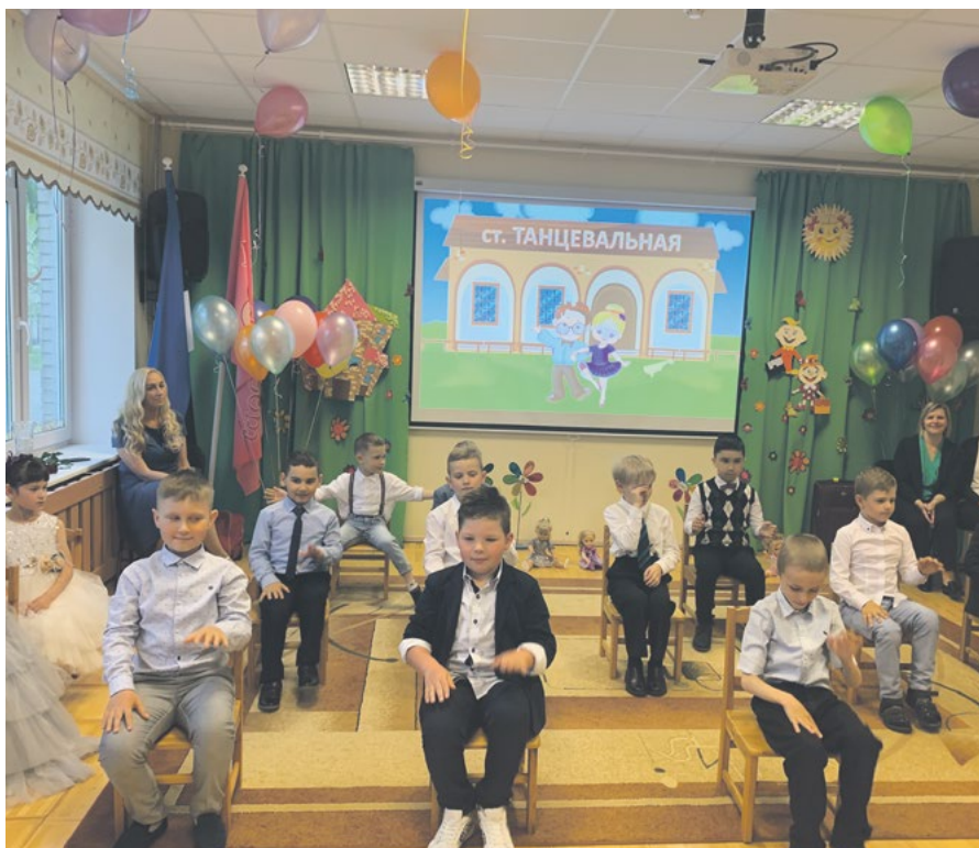
Выпускной групп «Буратино» и «Птенчики»

надо перейти. Праздник удался. Большое спасибо дорогим родителям и руководству детского сада «Рыим» за поддержку и помощь в организации и проведении выпускного! С одной стороны, это радостный, долгожданный праздник, с другой – немного грустное