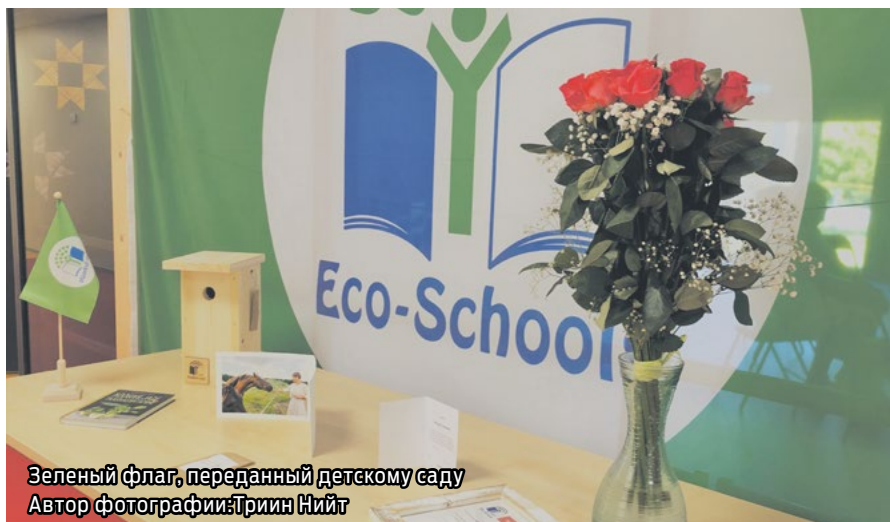
Зеленый флаг, переданный детскому саду

Одним из самых крупных предприятий в 2020 году для нас стал собственный благотворительный проект «Звери для хорошего настроения». Он был задуман, чтобы положить начало традиции благотворительных проектов в детском саду Мууга, развивать в детях эмпатию и участливость, привлечь родителей и работников детского