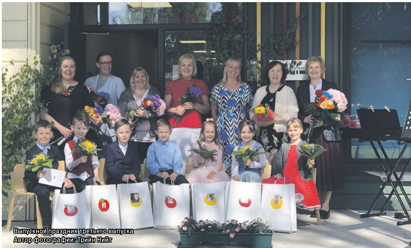
Выпускной праздник третьего выпуска