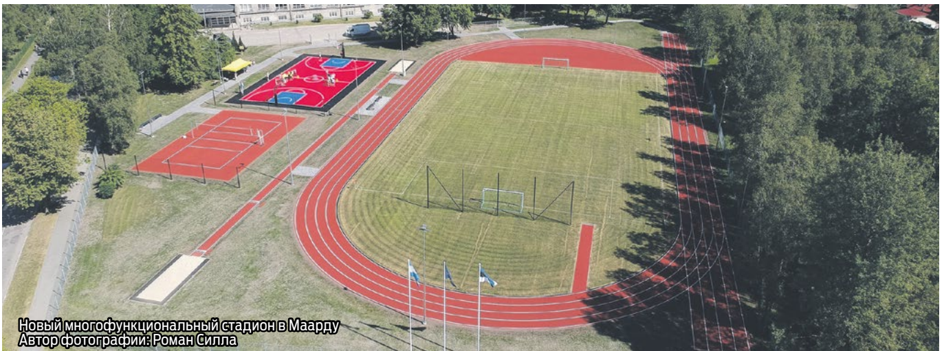
Новый многофункциональный стадион в Маарду