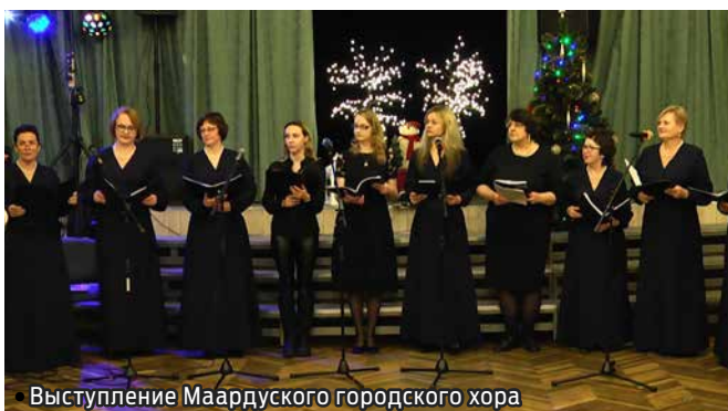
Выступление Маардуского городского хора

На праздничном концерте прозвучало много хороших слов и аплодисментов в адрес творческих коллективов «Рахвамая». Не лишним будет еще раз поблагодарить всех участников концерта-круиза за прекрасную подготовку мероприятия, благодаря чему была создана по-настоящему праздничная атмосфера.