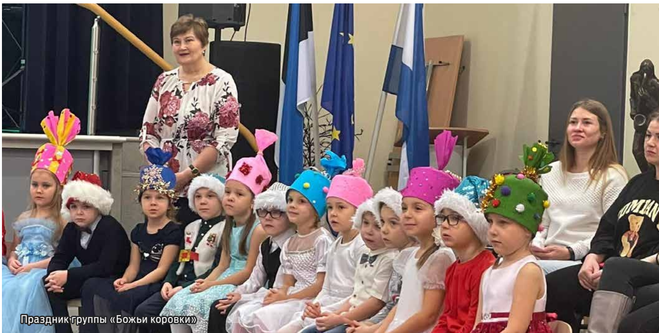
Праздник группы «Божьи коровки»