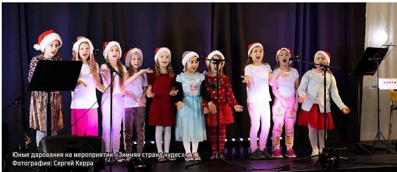
Юные дарования на мероприятии «Зимняя страна чудес»