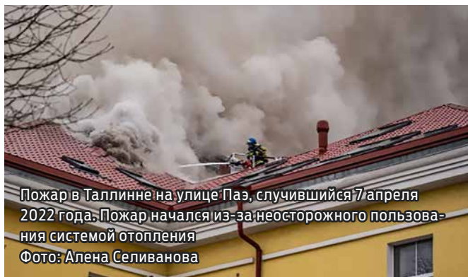
Пожар в Таллинне на улице Паэ, случившийся 7 апреля 2022 года. Пожар начался из-за неосторожного пользования системой отопления

С наступлением холодов спасатели получают много вызовов на пожары в жилых домах. При этом такие несчастные случаи на самом деле очень легко предотвратить, для чего стоит научить пожарной безопасности всех членов семьи, в том числе школьников, которые часто остаются дома одни, а также проследить, чтобы за одиночными пожилыми людьми в квартирном товариществе кто-то всегда присматривал.