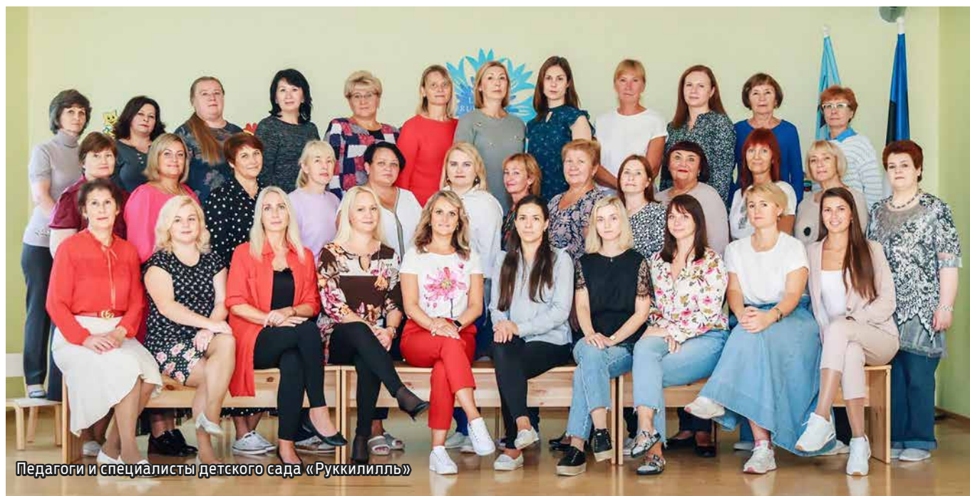
Педагоги и специалисты детского сада «Руккилилль»

Юбилей – это торжественный, волнующий и важный праздник. Это время подведения итогов, размышлений о достижениях, успехах и планах на будущее. Вот и наш любимый детский сад вскоре отметит свой очередной юбилей – 1 апреля детскому саду «Руккилилль» исполнится 35 лет!