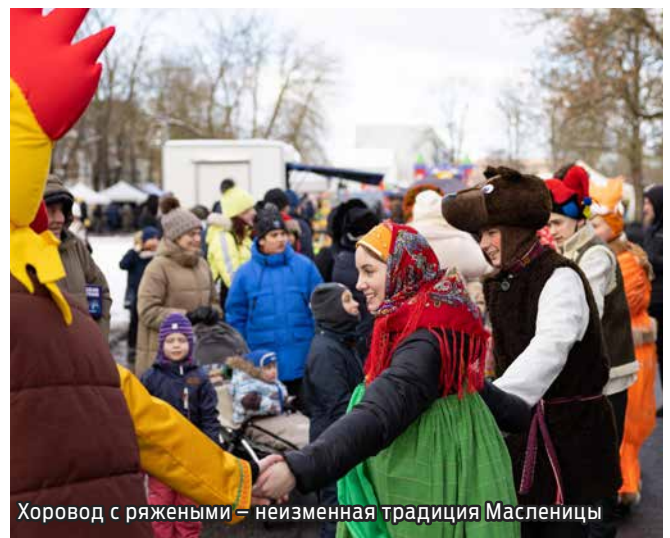
Хоровод с ряжеными – неизменная традиция Масленицы

Маардуский центр культуры и информации благодарит всех участников праздника и ждет вас на следующий маардуский Вастлапяэв, который состоится уже довольно скоро – 13 февраля 2024 года.