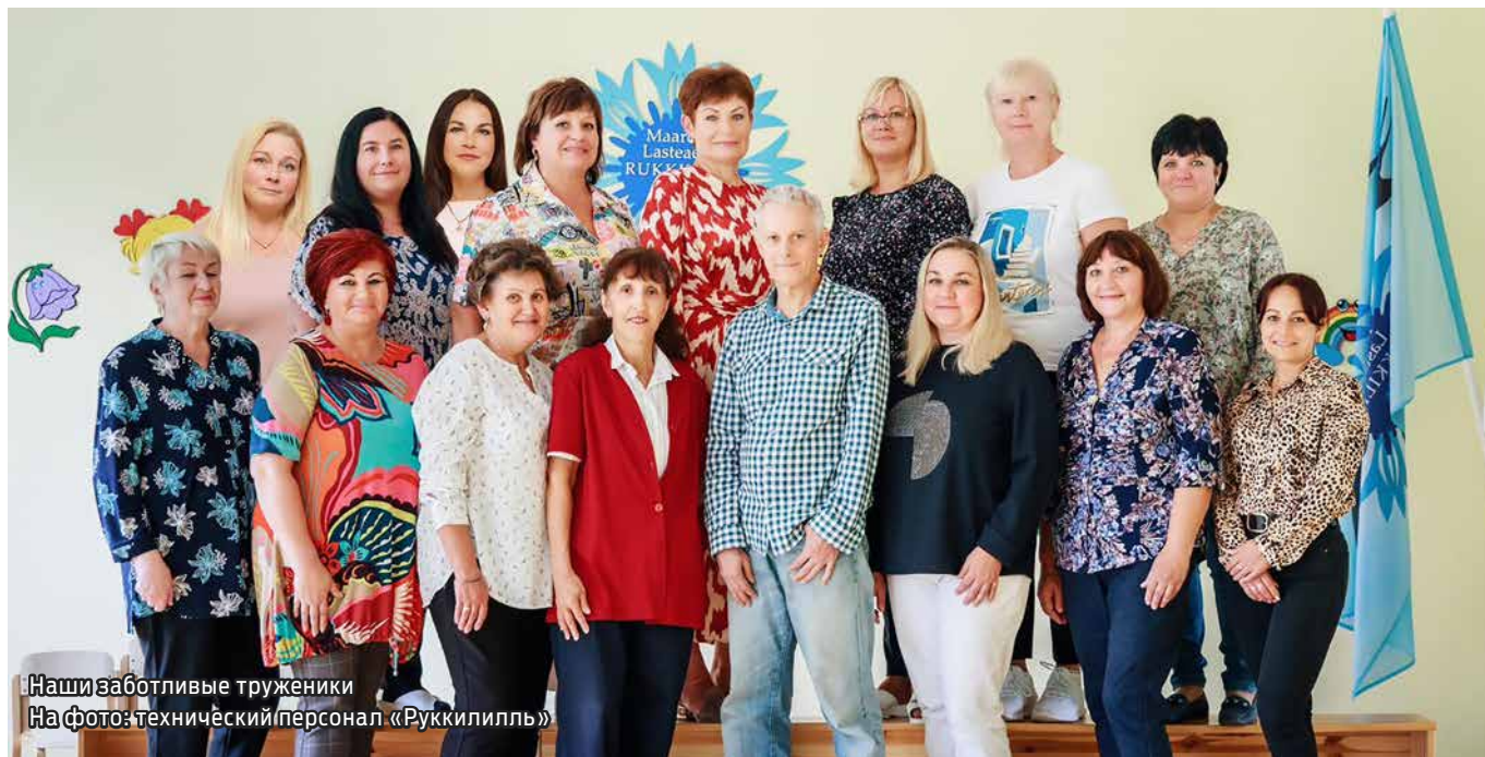
Наши заботливые труженики На фото: технический персонал «Рукиллиль»

За нелегкий и ответственный труд слов благодарности заслуживает каждый наш сотрудник, будь то педагог или технический работник, помощник или руководитель, работник