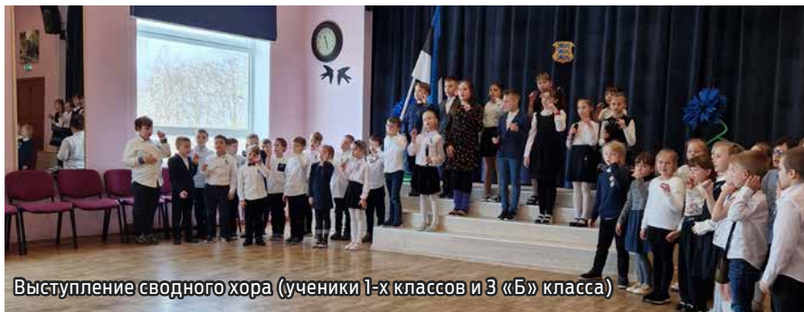
Выступление сводного хора (ученики 1-х классов и 3 «Б» класса)

23 февраля рабочий день был короче обычного и уроков было меньше, чем обычно. Начался он с тематического классного часа об Эстонии и закончился на приятной праздничной ноте – вся школа построилась во дворе для торжественного поднятия флага, после чего все ученики разошлись по домам отмечать праздник и встречать весенние каникулы.