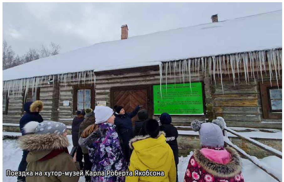
Поездка на хутор-музей Карла Роберта Якобсона

Уезжая, мы поняли, что многое узнали об истории культуры и традициях Эстонии. День получился интересным и принес много радости всем его участникам.