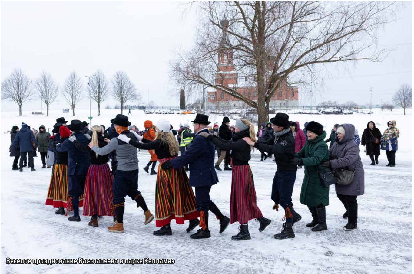
Веселое празднование Вастлапяэва в парке Келламяэ