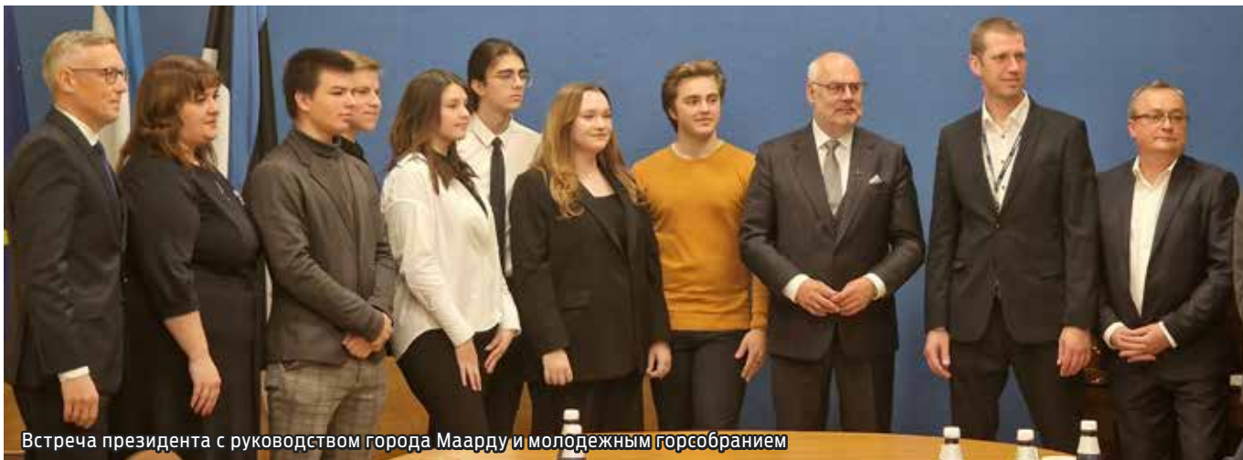
Встреча президента с руководством города Маарду и молодежным горсобранием

18 октября город Маарду посетил президент Эстонской Республики Алар Карис, который встретился с руководителями города и представителями молодежного горсобрания.