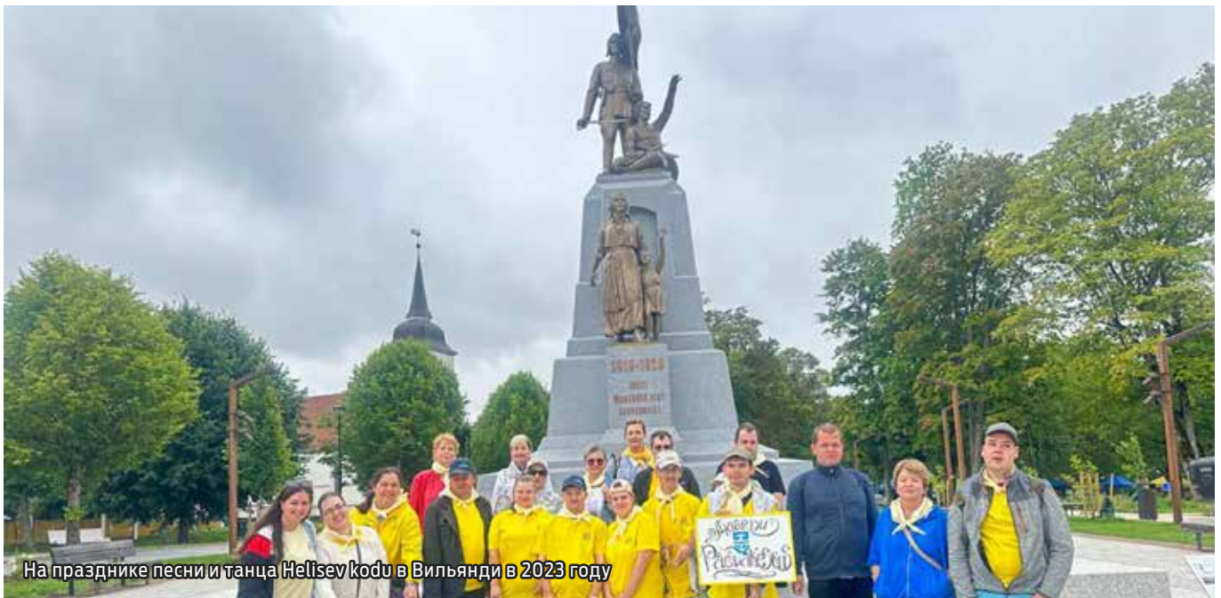
На празднике песни и танца Hellisev kodu в Вильянди в 2023 году