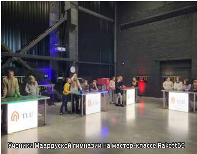
Ученики Маардуской гимназии на мастер-классе Rakett69