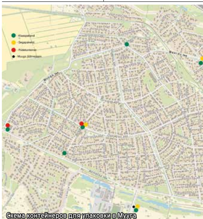
Схема контейнеров для упаковки в Мууга