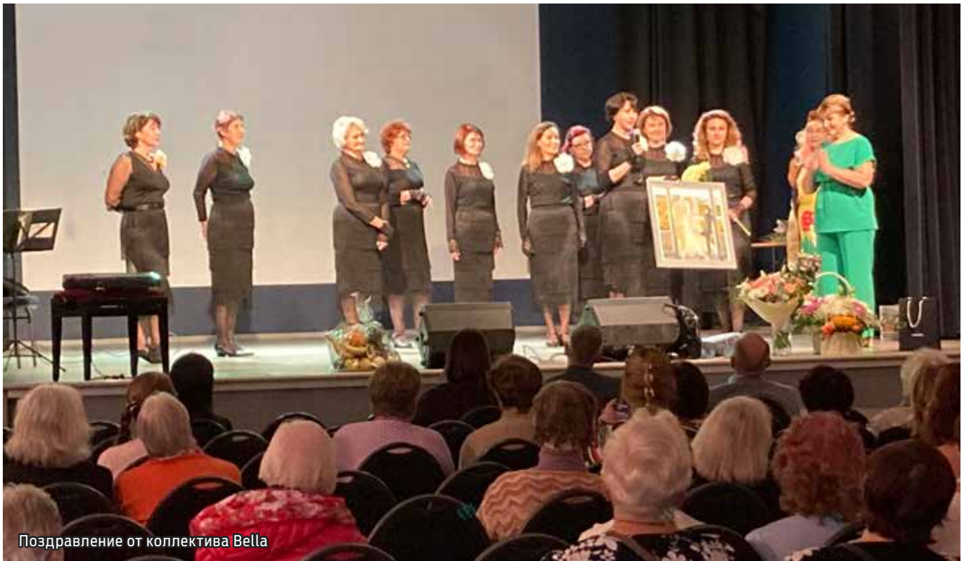
Поздравление от коллектива Bella

Пускай гуляет осень на дворе, А жизнь листаёт вновь страницы века. Как хорошо, что есть в календаре День пожилого человека. /Стихи из сценария праздника/