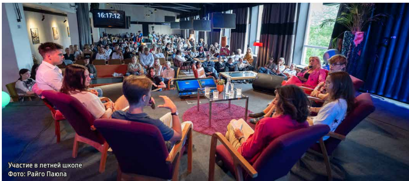
Участие в летней школе