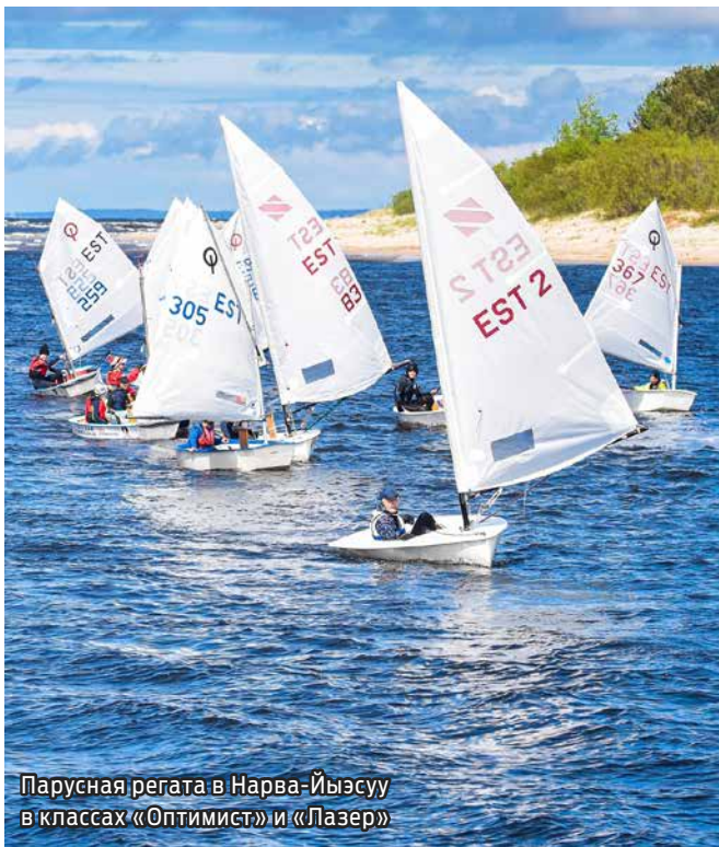
Парусная регата в Нарва-Йыэсуу в классах «Оптимист» и «Лазер»

Поздравляем наших юных яхтсменов и тренеров с отличным парусным сезоном и желаем полных парусов и дальнейших успехов!