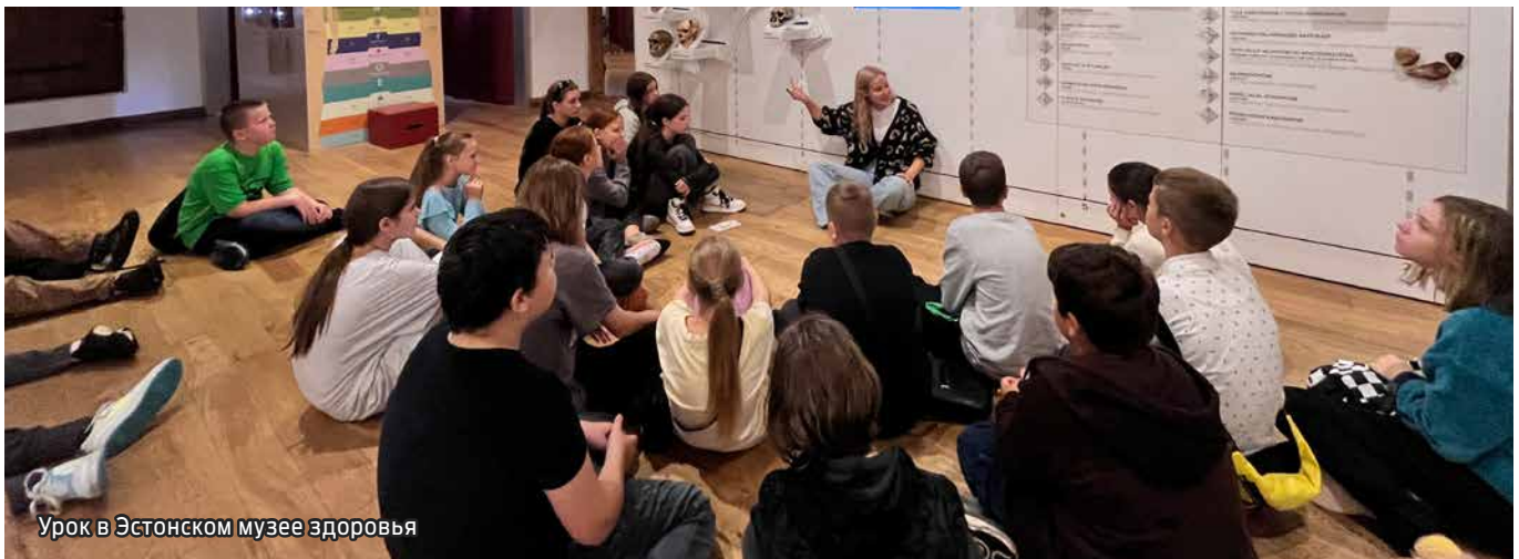
Урок в Эстонском музее здоровья