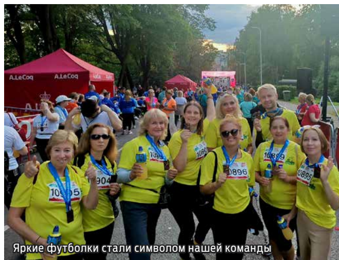
Яркие футболки стали символом нашей команды

Погода, благоприятная и солнечная, добавила энтузиазма и радости. Мы наслаждались красивыми видами города и