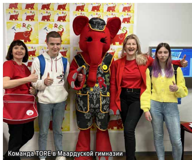
Команда TORE в Маардуской гимназии

Для учеников нашей школы участие в программе – это прекрасная возможность разнообразить школьную жизнь, развить социальные навыки, понять свое призвание в жизни.