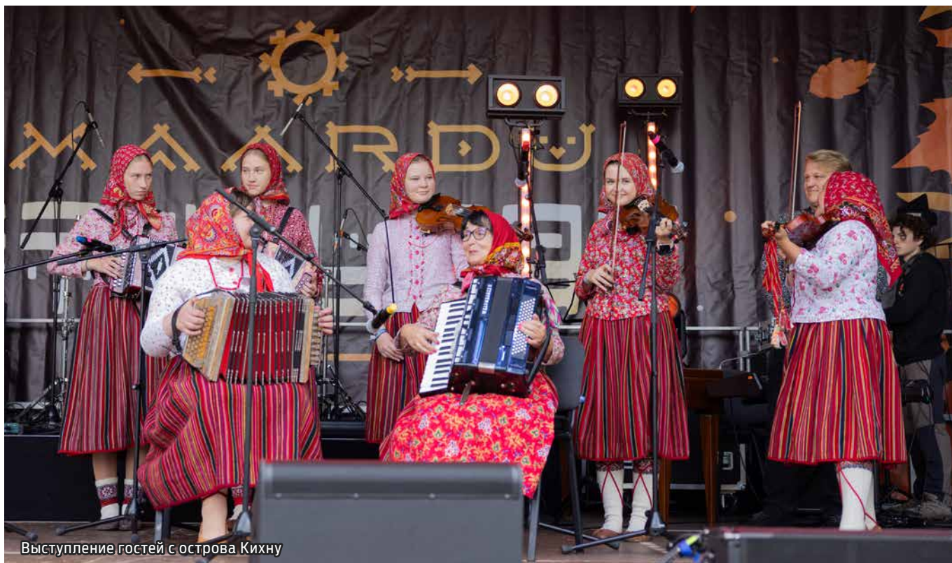
Выступление гостей с острова Кихну

Крупнейшая в масштабах всего Хартюмаа этно-ярмарка прошла в городе Маарду 9 и 10 сентября, порадовав местных жителей и гостей разнообразной культурной программой и крупнейшей торговой площадкой. Мероприятие собрало более 500 торговцев и около 400 талантливых артистов из 34 коллективов.