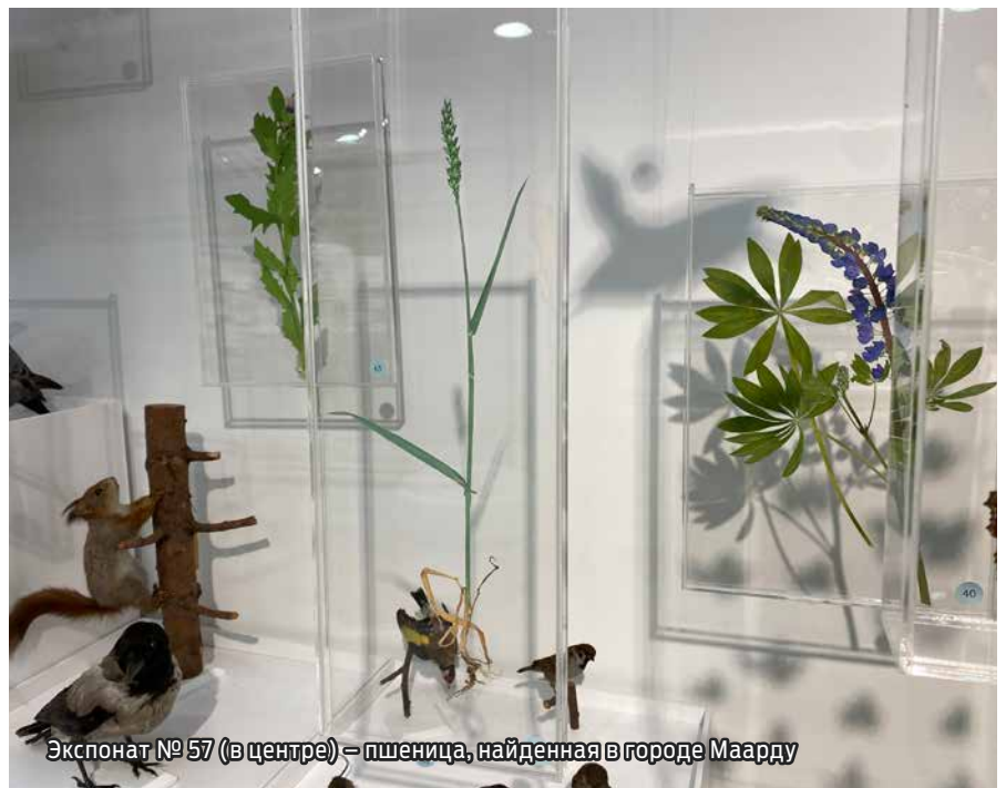
Экспонат № 57 (в центре) – пшеница, найденная в городе Маарду

На выставке можно познакомиться с 250 различными видами городской