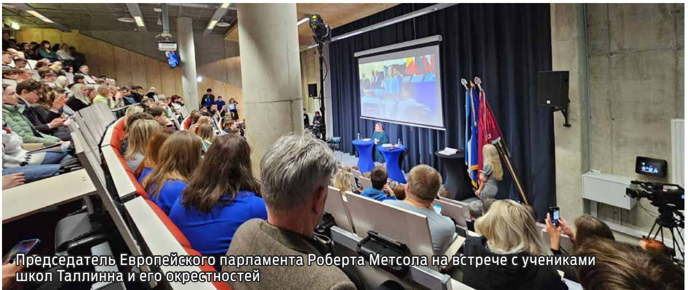
Председатель Европейского парламента Роберта Метсола на встрече с учениками школ Таллинна и его окрестностей

Ученики Маардуской гимназии участвуют в сети школ EPAS. Программа школ-партнеров Европейского парламента EPAS была запущена в 2016 году с целью ознакомления с европейской парламентской демократией, деятельностью Европейского парламента и европейскими ценностями путем проведения мероприятий и семинаров EPAS.