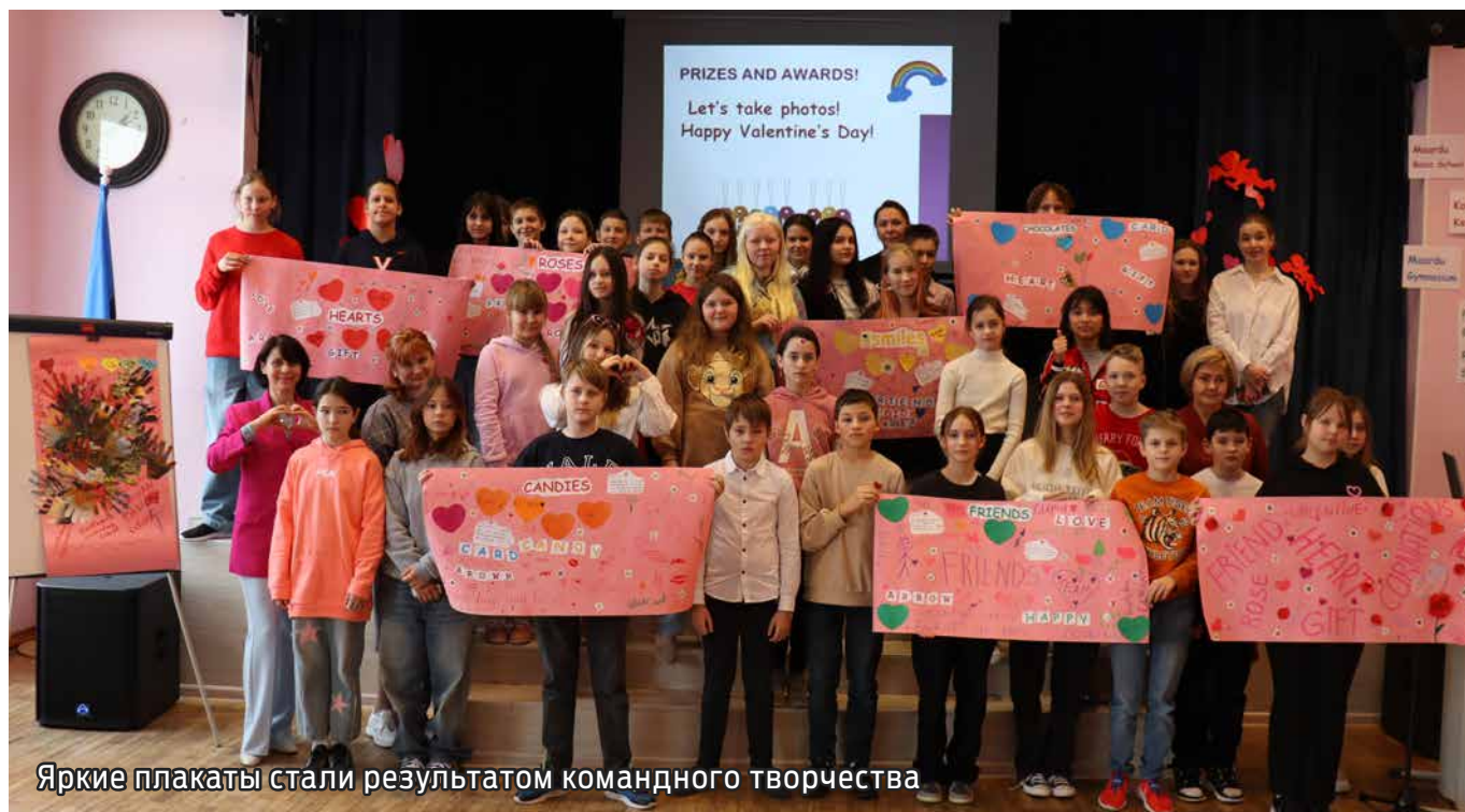
Яркие плакаты стали результатом командного творчества