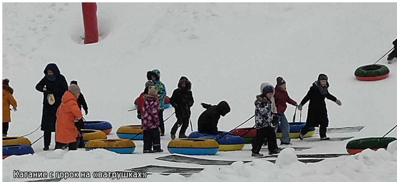
Катание с горок на «ватрушках»

Мы благодарим команду учителей эстонского языка Маардуской основной школы за сотрудничество в рамках школьного учебного проекта «Вастлапяэв».