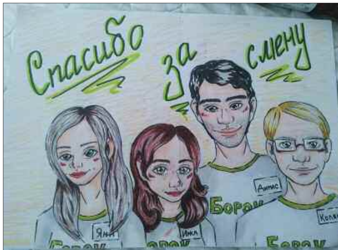
Joonistasid: Diana Gurova, Viktoria Djomina, Jelizaveta Popkova.

redad ja rühmajuhid sõbralikud; Ühe päeva jooksul oli rohkem emotsioone kui terve kuu jooksul;