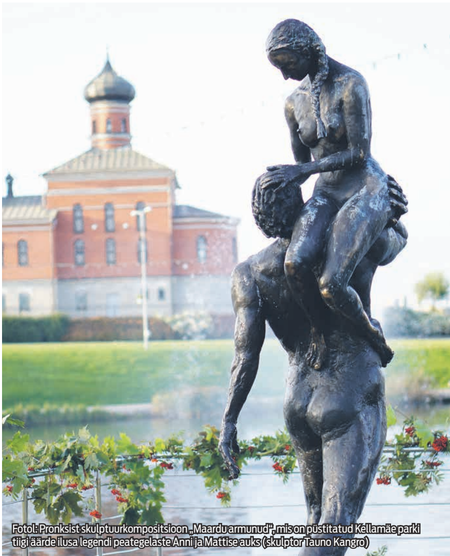
Fotol: Pronksist skulptuurkompositsioon „Maardu armunud“, mis on püstitatud Kellamäe parki tiigi äärde ilusa legendi peategelaste Anni ja Mattise auks (skulptor Tauno Kangro)

Järg. Legendi algust saate lugeda juulikuu numbrist.