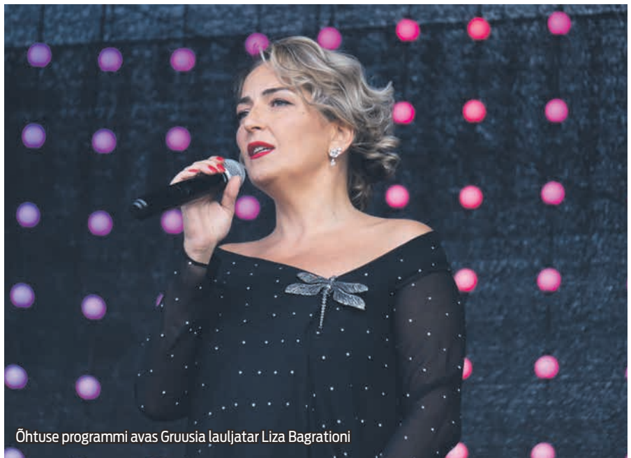
Õhtuse programmi avas Gruusia lauljatar Liza Bagrationi