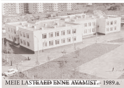
MEIE LASTEAED ENNE AVAMIST, 1989.a.

Juhataja asetäitja õppe- ja kasvatusöölal