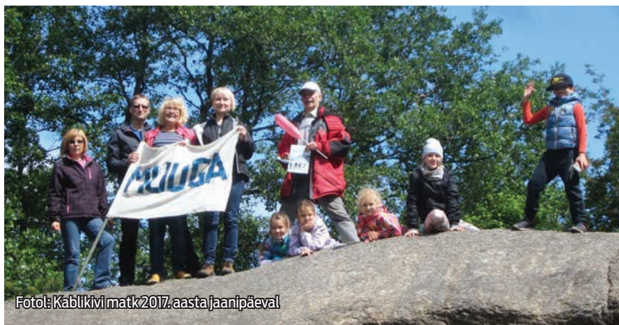
Foto: Kablikivi matk 2017. aasta jaanipäeval

Maardu linn toetab Muuga Seltsi tegevust igakuise tegevustoetusega (70 eurot kuus). Lisaks sai selts 2017. aasta märtsis sihtasutuselt Kodanikuühiskonna Sihtkapitali projekti