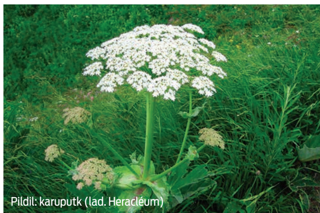
Pildil: karuputk (lad. Heracleum )

Soovin teile ja teie lastele ohutut suve!