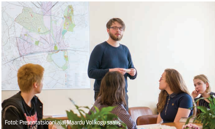
Fotol: Presentatsiooni ajal Maardu Volikogu saalis

• Linnas on kuus piirkonda: Kallavere ja Muuga elurajoonid, Kroodi ja Vana-Narva maantee tööstusrajoonid,