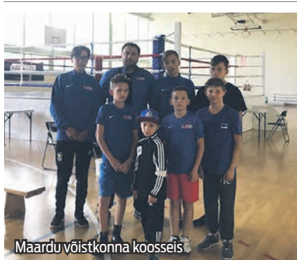
Maardu võistkonna koosseis

Klubi Olümp Maardu Kalev poksijad osalesid 21.–23. septembril Lätis Olaine linnas toimunud rahvusvahelisel poksiturniiril.