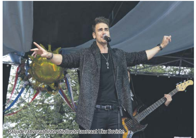
Paljude rahvusvahiste võistluste laureaat Uku Suviste