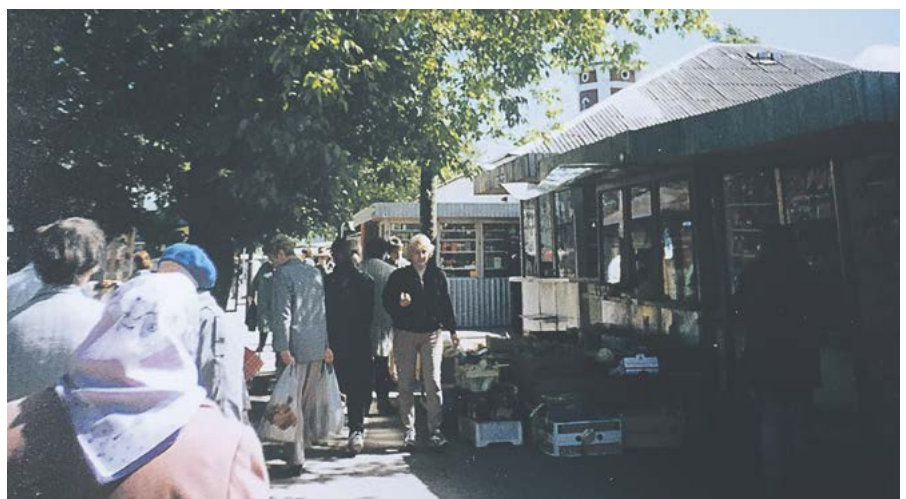
Maardu turu nädalapäevad

omanikud ning lahtiste lettide asemele tulid kioskid. Nüüd tuli ostude jaoks juba minna kioskitesse sisse, see ei olnud väga mugav ning ei meeldinud ostjatele sedavõrd. Sellest ajast alates hakkas kauplemine tasapisi vaiksemaks jääma.