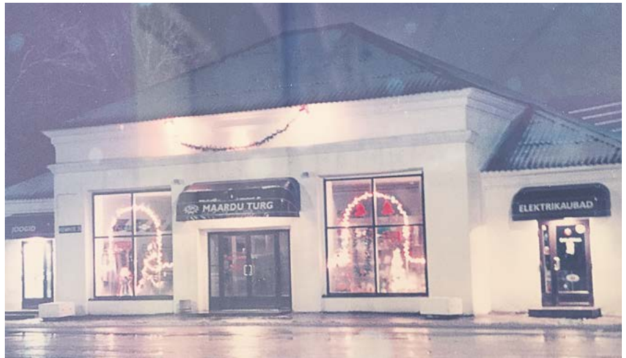
Kaunistatud turuhoone enne uue aasta pidustusi

Alguses toimus kauplemine müügiletidelt, ent mõne aasta pärast ilmusid turule