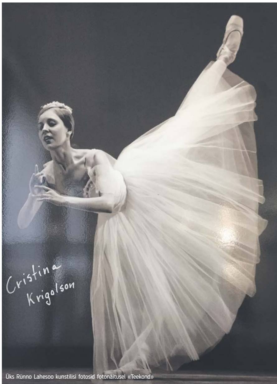
Üks Rünno Lahesoo kunstilisi fotosid fotonäitusel «Teekond»

Arvestades, et kollektiivid on kõik huvipõhised, tekkis ideaalne võimalus