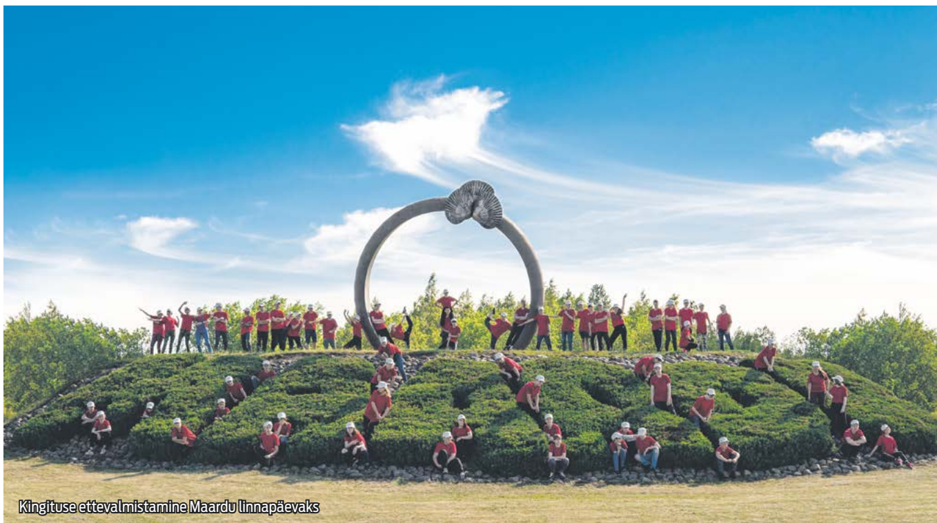
Kingituse ettevalmistamine Maardu linnapäevaks