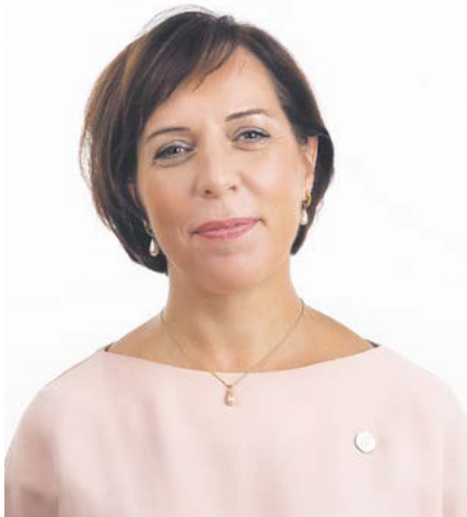
MAILIS REPS Haridus- ja teadusminister

Möödunud õppeaasta on olnud kahtlemata edukas. Haridusvaldkonda puudutavaid seadusi on muudetud ja raha investeeritud. Kõike selle nimel, et haridust edendada ja muuta veelgi tõhusamaks.