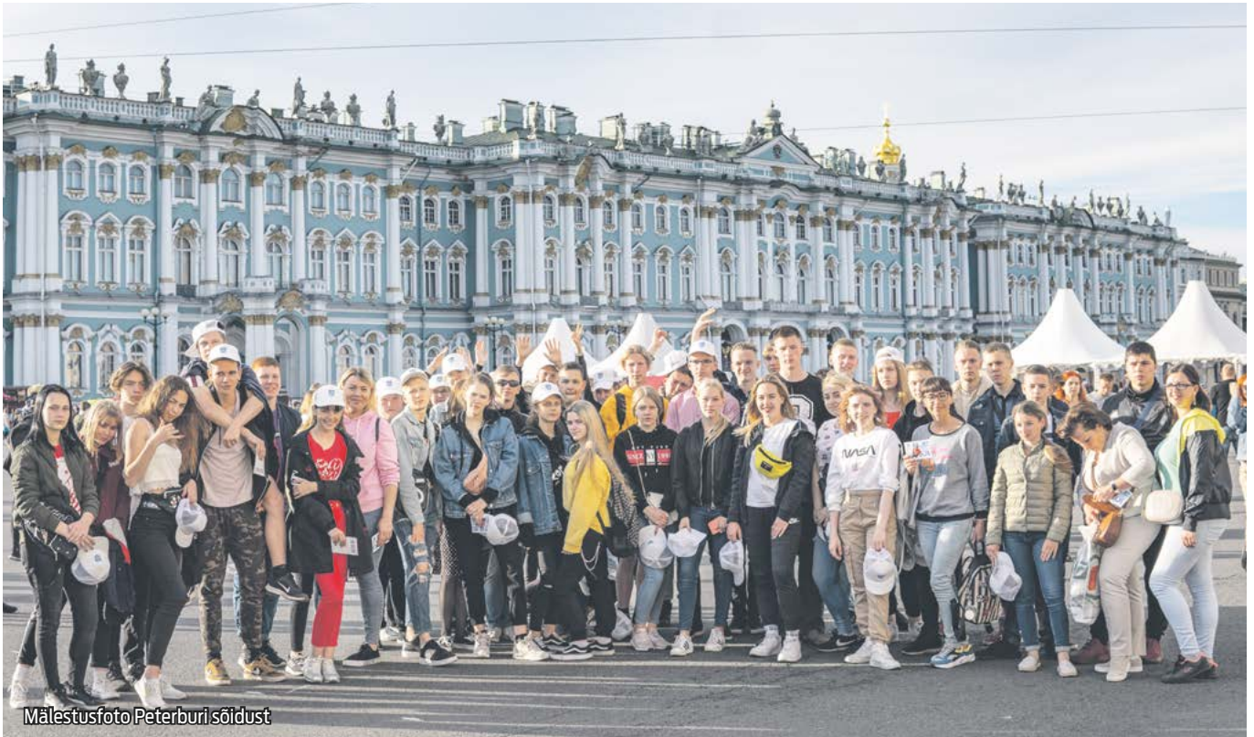
Mälestusfoto Peterburi sõidust