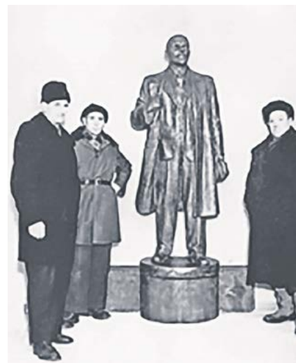
See Lenini ausammas, mis seisib praeguses põhikoolis kuni 1990. aastani, oli nõukogude ajal ainus