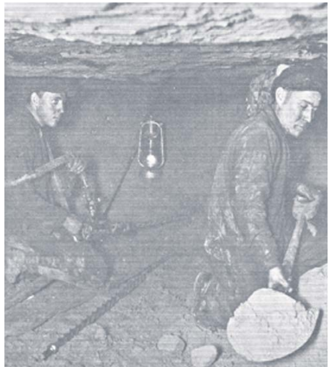
Nii kaevandati kunagi fosforiidimaaki - kitsastes maa-alustes käikudes, primitiivsete tööriistadega.