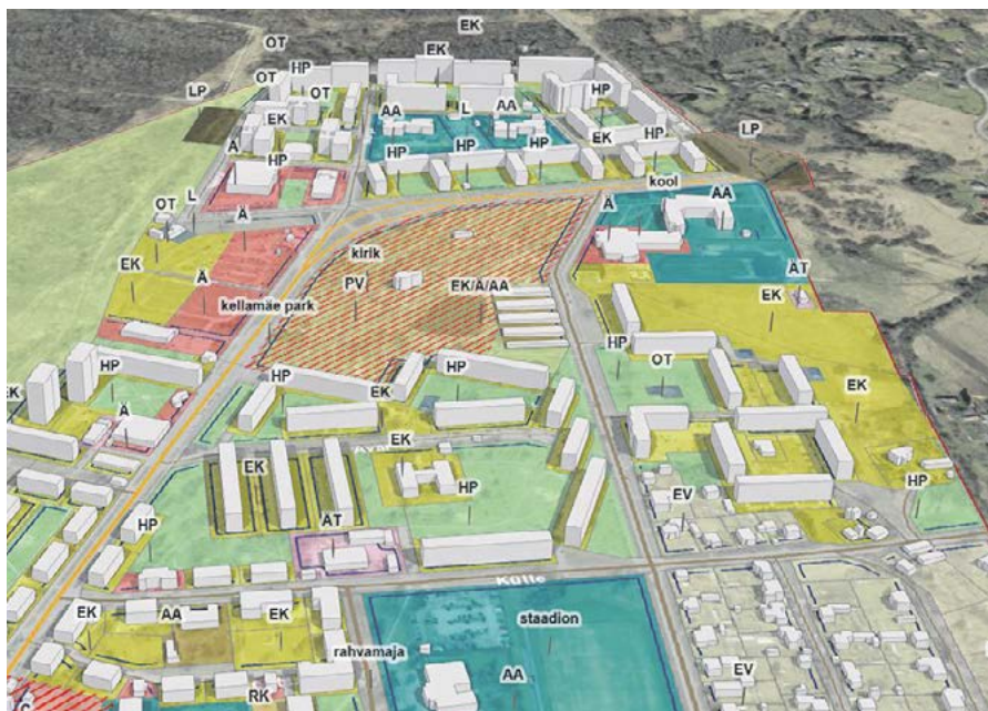
Väljavõte Maardu linna üldplaneeringu 3D-rakendusest ( http://www.hendrikson.ee/maps/Maardu-ÜP )

Maardu linna üldplaneeringu ja üldplaneeringu KSH aruande eelnõu avalik väljapanek toimub 01.04.2019 kuni 30.04.2019 . Avaliku väljapaneku jooksul saab üldplaneeringu ja KSH eelnõuga tutvuda elektrooniliselt linna veebilehel http://maardu.kovtp.ee/uldplaneering ning paberikandjal Maardu linnavalitsuses tööpäeviti tööaegadel. Avaliku väljapaneku perioodi alguseks valmib ka 3D-rakendus Maardu linna üldplaneeringu maakasutusplaaniga tutvumiseks http://www.hendrikson.ee/maps/Maardu-ÜP .