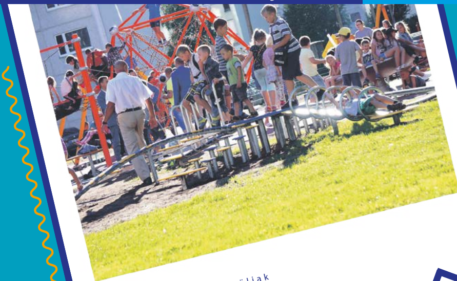
Veeru tänava mänguväljak