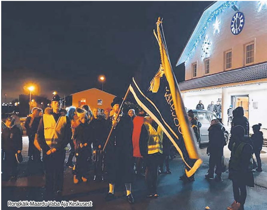
Rongkäik Maardu Vaba Aja Keskusest