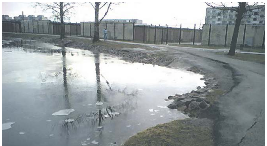
Tol ajal kui Maardu tiigil polnud veel kaunist skulptuuri legendi kangelastest.

Mäletan, et need olid väikesed, logisevad bussid ja alati inimesi pilgeni täis. Jõuga bussi trügimine oli siis tavaline asi.