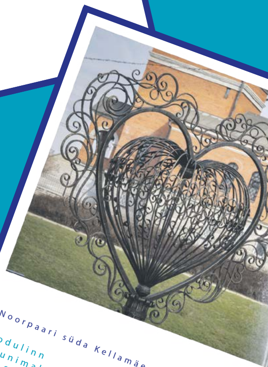
Noorpaari süda Kellamäe pargis Kodulinn Kaunimaks 2018 idee