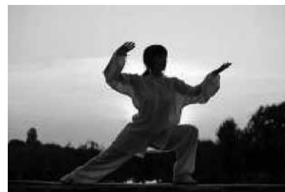
Sel päeval ühineb tai chi ja qigongi liikumisega sadu inimesi (Foto: Lipik, Shutterstock)

Allikas: http://www.calend.ru/holidays/0/0/536/ © Calend.ru.