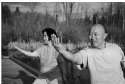
Tai chi ja qigongi on kõigile jõukohased

Tai chi ja qigongi päev sai ülemaailmselt tuntuks 1999. aastal. Ent ülemaailmsetele üritustele tõuke andnud esmasinemine leidis aset Kansas Citys (Missouri osariik). Sellele Kansas City Nelson Atkinsi muuseumis korraldatud tai chi