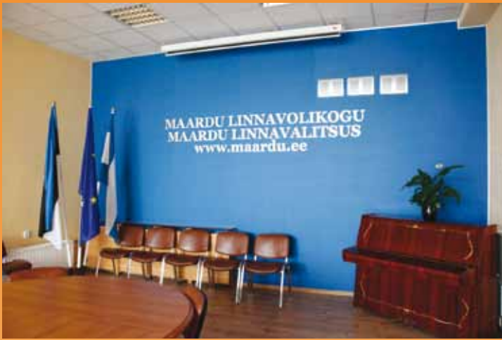
Linnavolikogu ja linnavalitsuse uuenenud saal