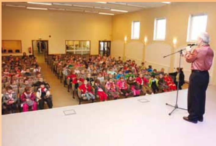
Hommikupoolik naeruga Vabaajakeskuses 1. aprillil