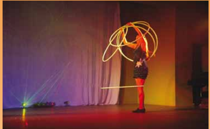
Tuletsirkuse etendus Maardus 13. aprillil