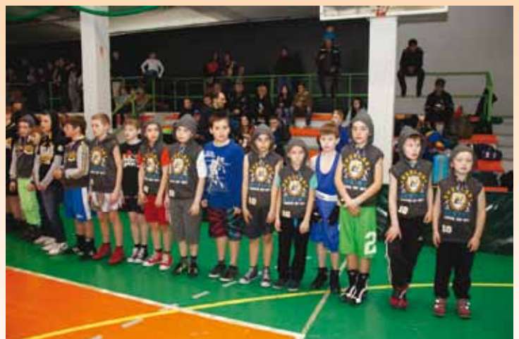
Rahvusvaheline A. Baranovi nim. poksiturniir Maardus 11.-12. aprillil